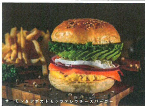
サーモン & アボカドモzzarellaチーズバーガー

<All prices are tax included./全て価格は税込です。>