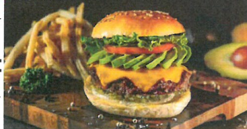
アボカドチーズバーガー

具材：ビーフパティ / グリルオニオン / レタス / ピクルス / テリヤキソース / マヨネーズ