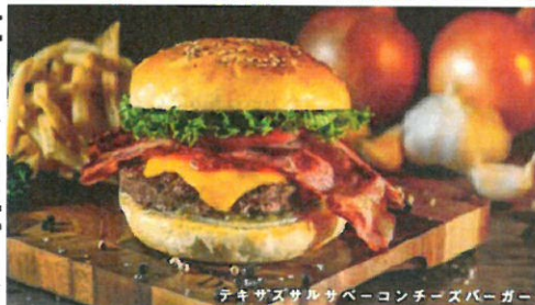
テキサスサルサペーコンチーズバーガー