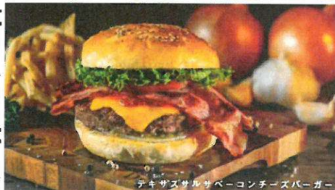
テキサスサルサペーコンチーズバーガー