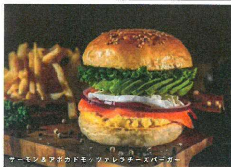
サーモン&アボカドモzzarellaチーズバーガー

<All prices are tax included./全て価格は税込です。>