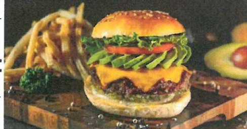
アボカドチーズバーガー

具材：ビーフパティ / グリルオニオン / レタス / ピクルス / テリヤキソース / マヨネーズ