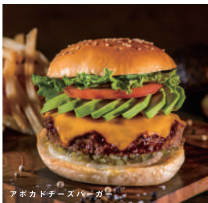
アボカドチーズバーガー